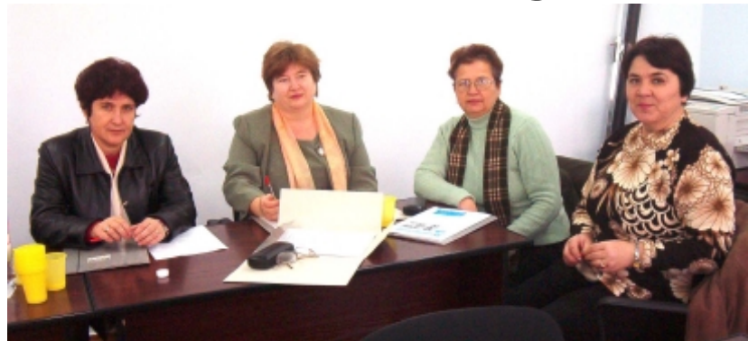
Echipa din Cahul la CRRAS

Un rol deosebit de important în perfecționarea profesorilor care